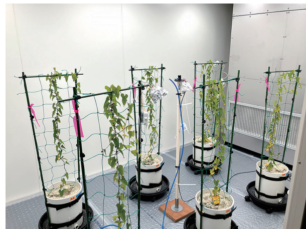
植物栽培装置による実験の様子

調査の内容や成果等はホームページ ( https://www.aomori-hb.jp/ ) に掲載されています。